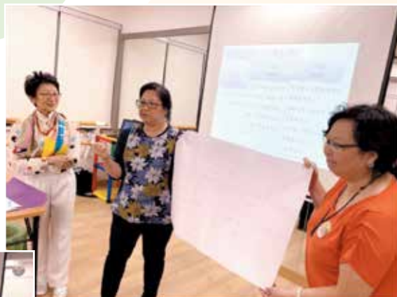
敢於查找不足，樂於分享資源