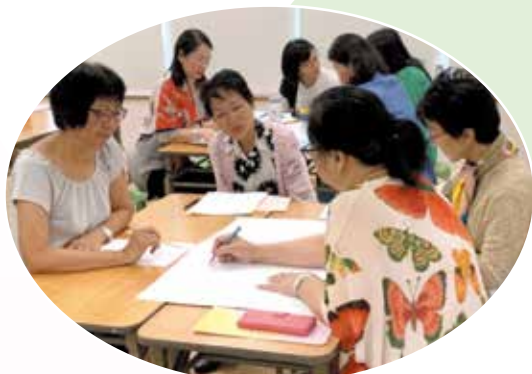
積極思考及討論分析機構現況