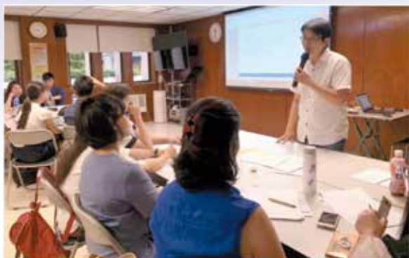
導師透過分析基金會的取向，帶領同學們一步步了解資助與被資助的價值。