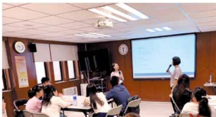
課堂上互動與分享，為學習帶來思考與啟發。