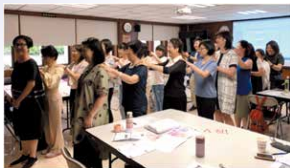
聚精會神上課一整天，同學們齊來鬆一鬆吧！