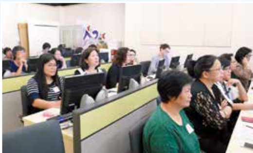
同學們認真學習，全神貫注，珍惜課堂時光。