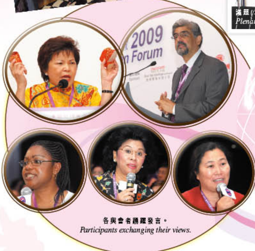
各與會者踴躍發言。 Participants exchanging their views.