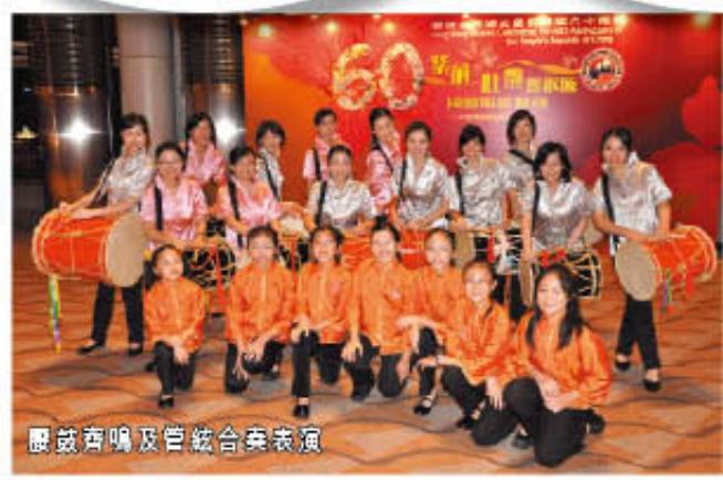
腰鼓齊鳴及管絃合奏表演