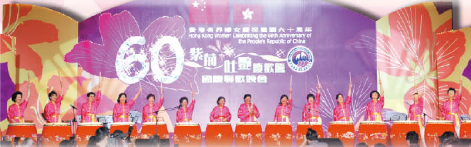
本會各首長演出的「領導擊鼓」贏得全場掌聲不絕 "Drum Performance" by HKFW leaders

The Federation and its Organizing Committee were happy to see that its effort had been highly recognized by the national leader Madam Chen Zhili who, having traveled all the way from Beijing, added honour to all of the celebration events by gracing the Federation with her presence. The highlighting events of this year's celebration were the Gala Dinner and the Asia Pacific Women Forum 2009.