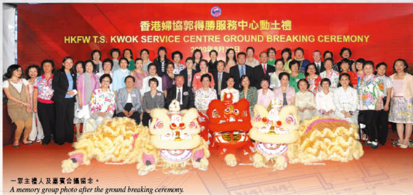
一眾主禮人及嘉賓合照留念。

A memory group photo after the ground breaking ceremony.