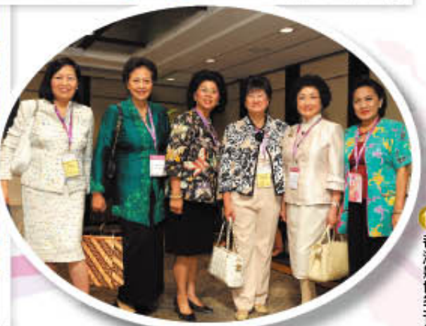
香港婦女企業家委員會特別安排聯誼茶會，於論壇後招待來自國內不同省份及亞太區之企業家，聯繫情誼，加強網絡交流。 Networking Tea Party for Mainland and Asia Pacific Participants hosted by the HKFW Entrepreneur Committee.