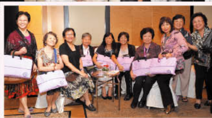
各地的代表踴躍交流。 Delegates participating in views exchange.