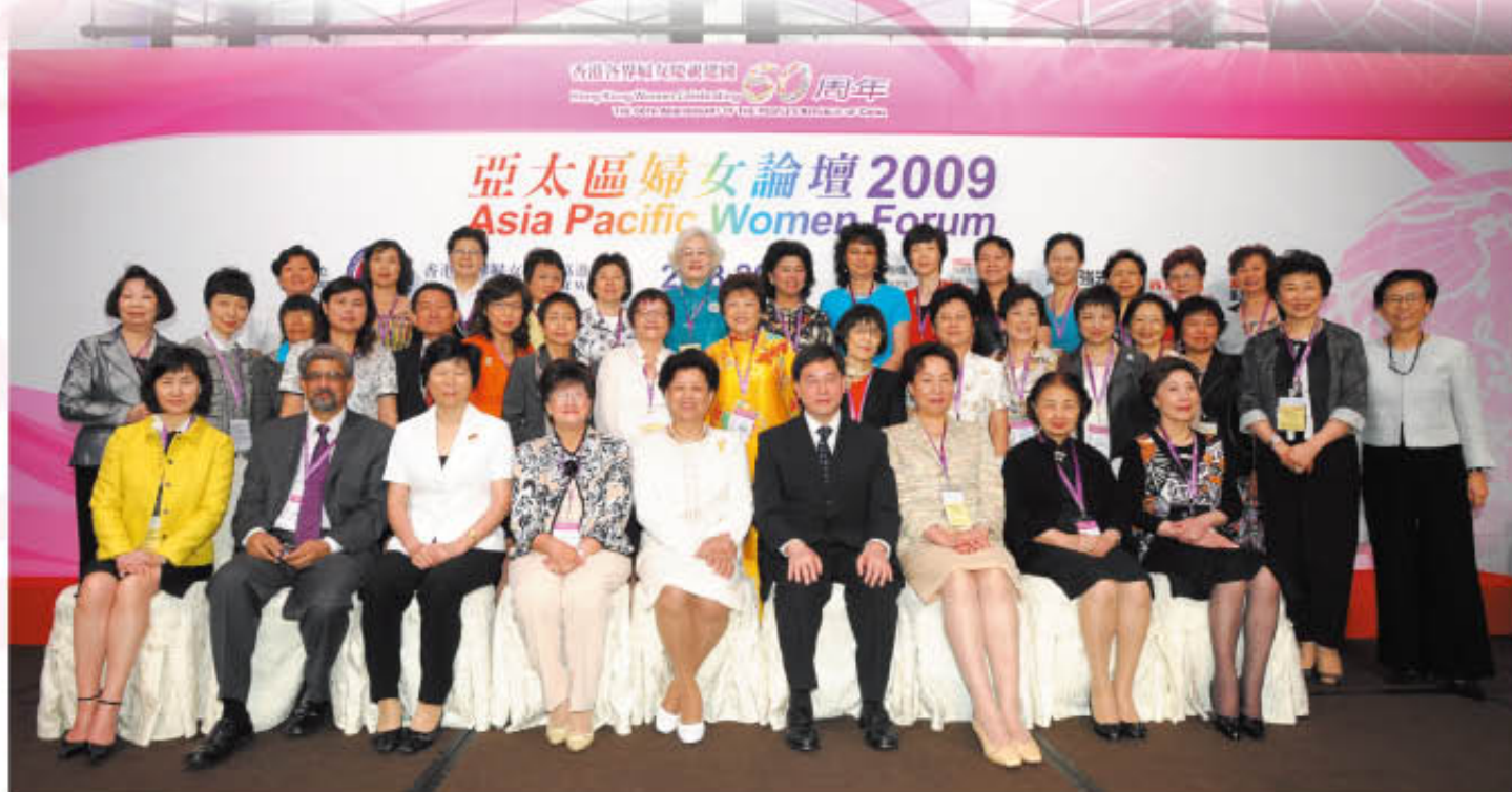
主禮嘉賓與會議發言嘉賓及代表團首長合照。

亞太區婦女論壇 2009 Asia Pacific Women Forum 2009