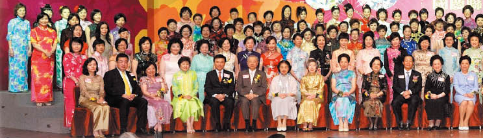
一眾主禮人與各界婦女領袖合照 A memory group photo of the officiating guests and Hong Kong women leaders.