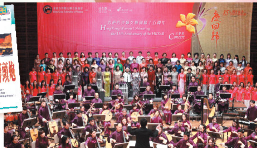
2012年，婦協合唱團於「香港各界婦女慶回歸十五周年音樂會」與香港中樂團同場演出。