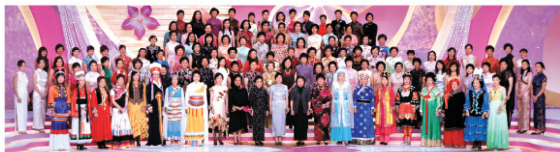
婦協合唱團多次在「紫荊吐艷慶歡騰」國慶晚會獻唱「回歸頌」。