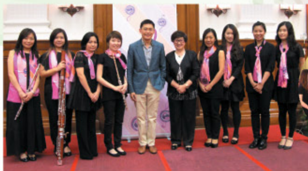
香港婦協六藝管弦(「樂團」)與香港大學聯合舉辦「音樂聚會」音樂會。