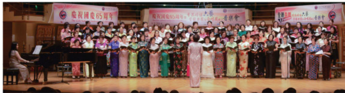
六藝合唱團於「慶祝國慶65周年暨香港婦協六藝管弦樂團及合唱團成立音樂會」演出。