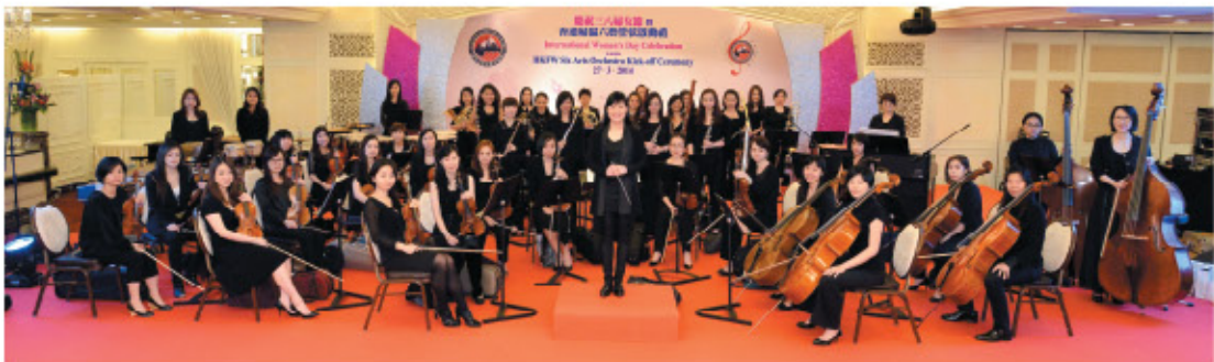
樂團於「慶祝三八婦女節暨香港婦協六藝管弦啟動禮」中大合照。