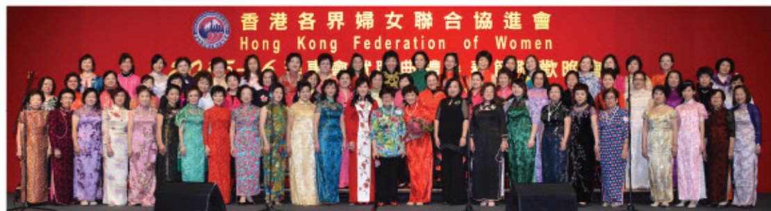
六藝合唱團於「2015-16年度理事會就職典禮暨春節聯歡晚會」演出。