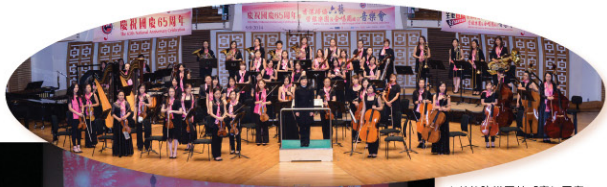
六藝管弦樂團於「慶祝國慶65周年暨香港婦協六藝管弦樂團及合唱團成立音樂會」演出。