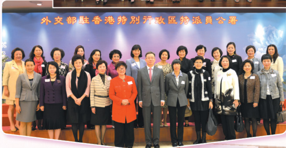
參觀外交部駐港特派員公署， 獲宋哲特派員接見。 Visited the Office of the Commissioner of the Ministry of Foreign Affairs of the People's Republic of China in the HKSAR.