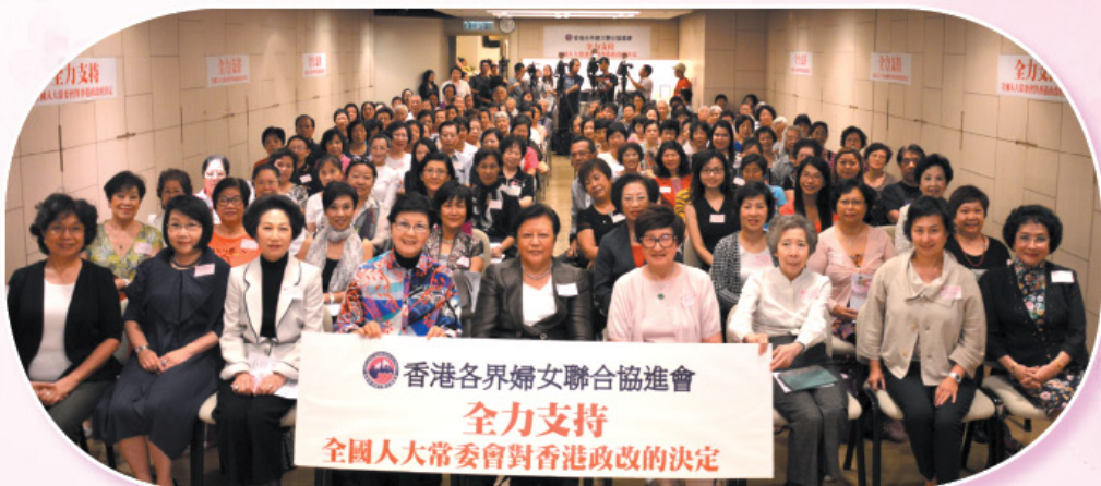
「解讀全國人大常委會對香港政改的決定」講座。(范徐麗泰主講) Seminar on "Understanding the NPCSC's Decision" by Dr. the Hon. Mrs. Rita Fan.