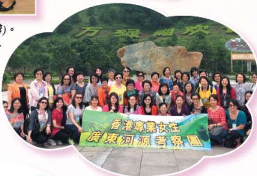
參與廣東河源考察。 Participated in Guangdong Heyuan Mission Tour.