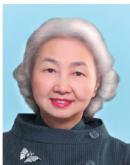
梁愛詩女士 The Hon. Elsie Leung G.B.M., J.P.