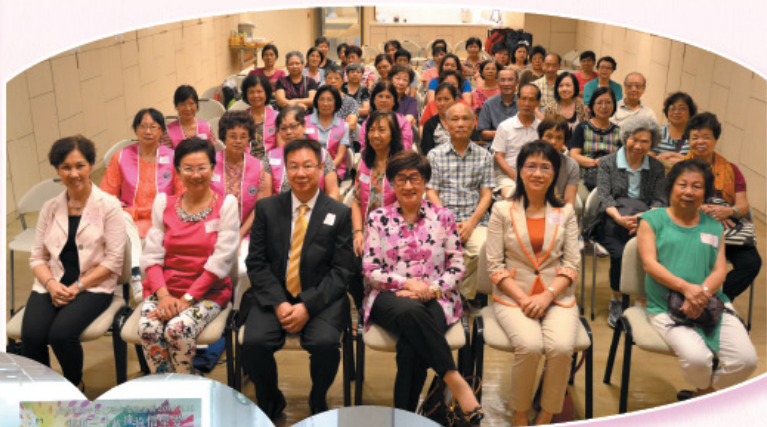
「築福香港」關懷長者眼科檢查儀式。 Ceremony of Bless HK-Eye Caring Campaign for the Elderlies.