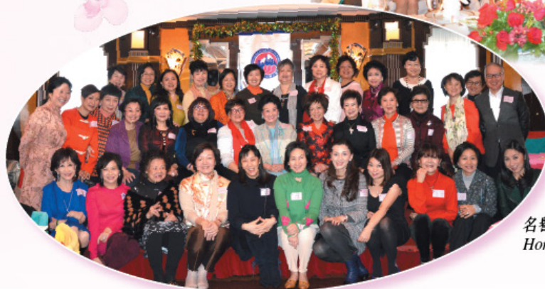
名譽會長聖誕歡聚。 Honorary Presidents' Christmas Party.