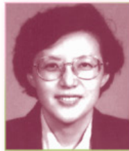
范徐麗泰 Rita Fan