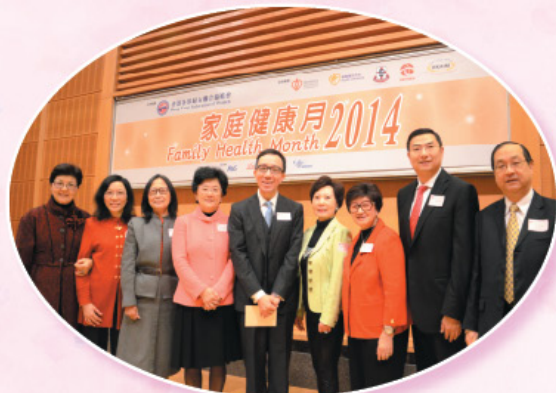
主辦「家庭健康月2014」。 Organized Family Health Month 2014.