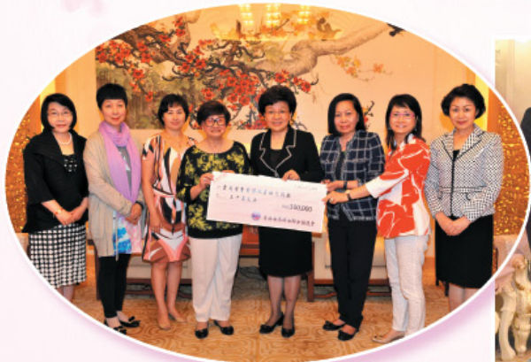
向雲南魯甸縣地震災民捐助30萬港元。 Donated HK$300,000 to the earthquake victims of Ludian, Yunan.