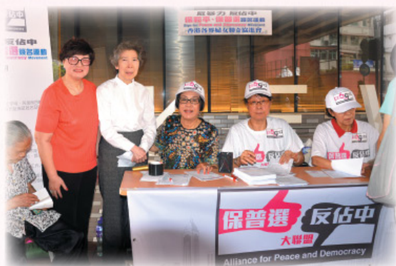
參與「保普選、反佔中」簽名運動， 設置旗艦簽名站。 HKFW joined the "Sign for Peace and Democracy Movement" as one of the flagship signature points.