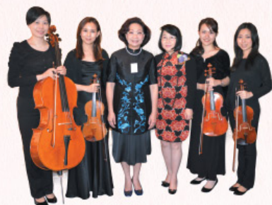
特首夫人與領事配偶午宴。

International Women's Day Celebration cum HKFW Six Arts Orchestra Kick-off Ceremony.