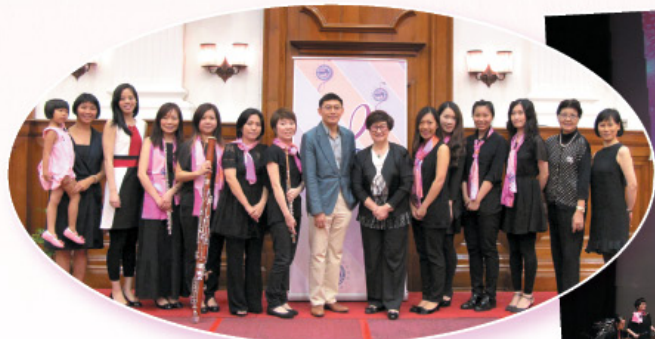
與香港大學合辦「音樂聚會」音樂會。 Co-organizing Music Rendezvous with University of Hong Kong.

Consular corps' spouses group lunch with the wife of the Chief Executive of the HKSAR.