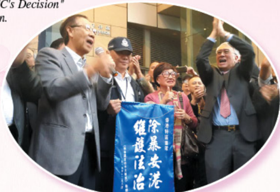
籌組及參與「心湯行動」， 安排向前線警務人員送湯。 Planned and participated in "The Soup Action" and sent cup soups to police officers.