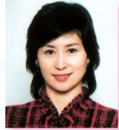
副主席 何超瓊 Pansy Ho Vice Chairperson