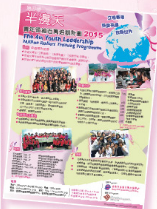
籌辦「第四屆半邊天青年領袖百萬培訓計劃」。 Organized the 4th Youth Leadership Million Dollars Training Programme.