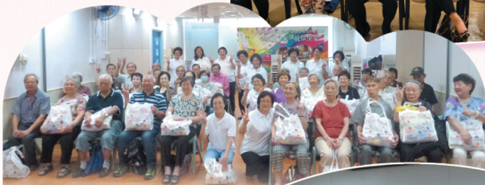
捐款及參與慶祝香港特別行政區成立十七周年「活力·愛@慶回歸」之關懷送愛行動。 Donated and participated in Vitality.Love@HKSAR.