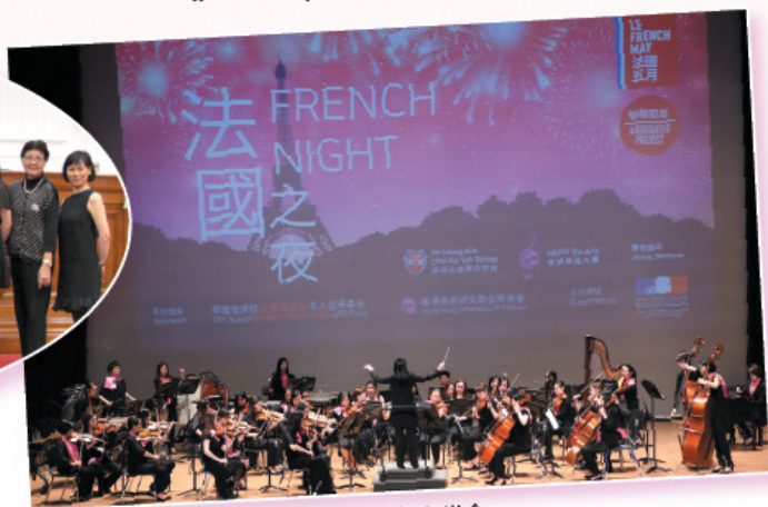
「法國五月」藝術節之「法國之夜」音樂會。 Le French May-French Night Concert.