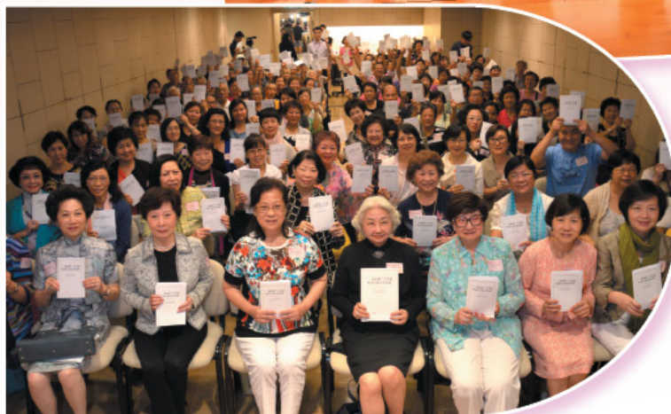
「一國兩制」在香港特別行政區 實踐白皮書座談會。 (梁愛詩主講) Seminar on White Paper on "The Practice of the 'One Country, Two Systems' Policy in the HKSAR" by the Hon. Elsie Leung.