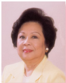
董趙洪娉女士 (行政長官董建華夫人) Mrs. Betty Tung, J.P.

(Wife of the HKSAR Chief Executive Mr. Tung Chee Hwa)