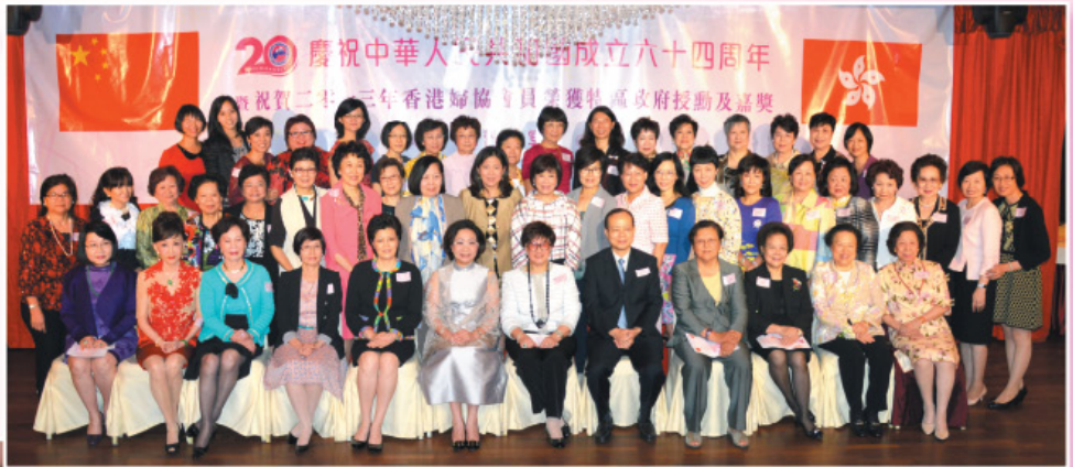
慶祝中華人民共和國成立 64周年暨祝賀婦協會員 2013年榮獲特區政府授 勳及嘉獎聯歡晚宴。 The 64th National Anniversary Celebration cum HKFW Members receiving Medals from the HKSAR Government 2013.