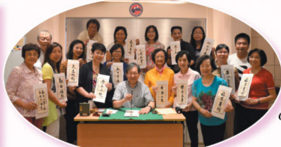
毛筆書法班。 Chinese Calligraphy Class.