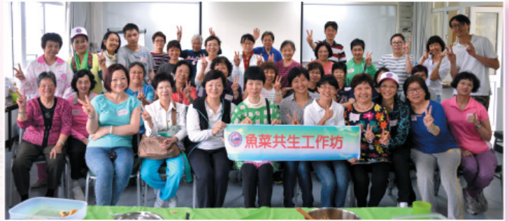
魚菜共生工作坊。 Aquaponics Training Workshop at Kadoorie Farm and Botanic Garden.