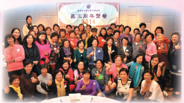
義工周年聚餐。Volunteers' Annual Dinner.