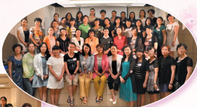
「貴州省公務員婦女幹部培訓班」到訪本會。 Guizhou Province Civil Service Training Class - women cadres visited HKFW.