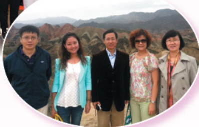
2014港澳青年英才訪問甘肅交流團。 Participated in an exchange trip to Gansu province.