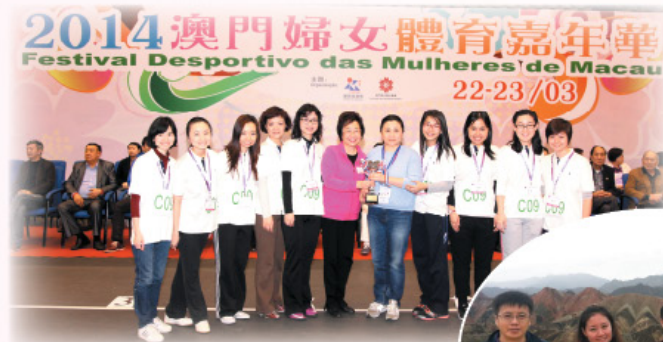
青年領袖同學會代表出席2014澳門婦女體育嘉年華勇奪殊榮。 HKFW youth leaders awarded in the 2014 Macau Women's Sport Carnival.