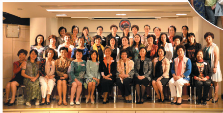
接待中國女企業家協會30多人。 Received more than 30 representatives from China Association of Women Entrepreneurs.