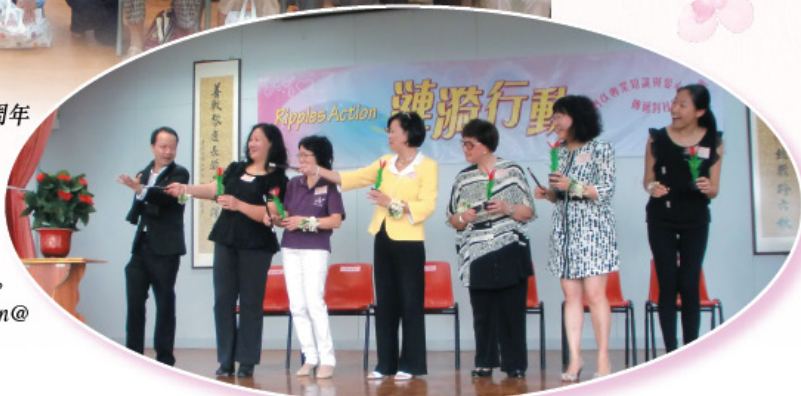
主辦漣漪行動@九龍城。 Organized Ripples Action@Kowloon City.