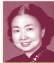
梁愛詩 Elsie Leung