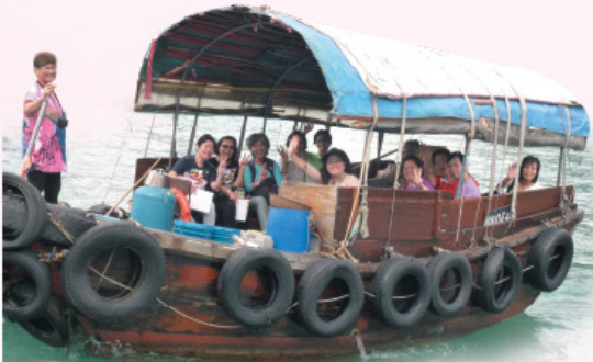
南區漁港遊。 A trip to visit the Southern District.