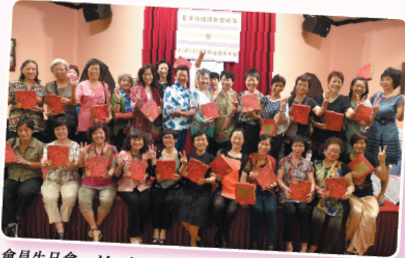
會員生日會。Members' Birthday Party.