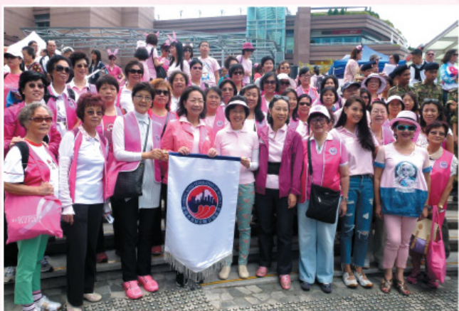
參與「乳健同行」步行籌款2014。 Participated in Pink Walk 2014.