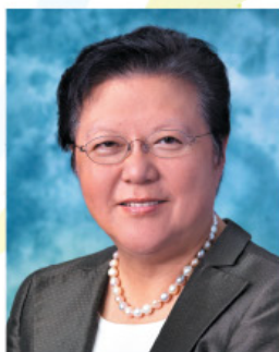
范徐麗泰博士 Dr. the Hon. Mrs. Rita Fan G.B.M., G.B.S., J.P.