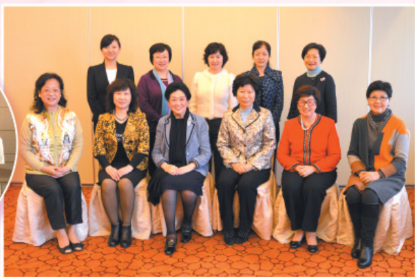
全國人大常委會委員暨前全國婦聯副主席陳秀榕到訪。 Madam Chen Xiurong, member of NPCSC, visited HKFW.