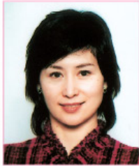
何超瓊 Pansy Ho