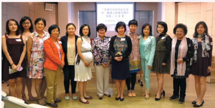
「年青女性如何在生活中、職場上裝備及提升自我」分享會(何超瓊主講)。 Sharing on "Tips for young women to equip themselves" by Ms. Pansy Ho.