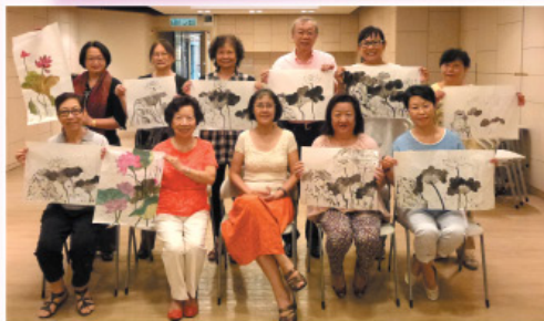
國畫班。Chinese Painting Class.