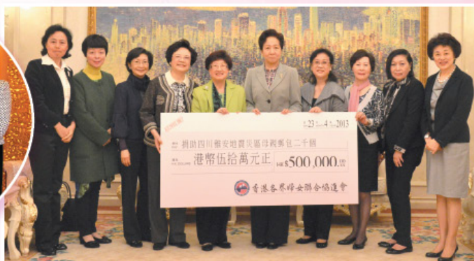
捐贈「母親郵包」援助四川雅安災民(總捐贈額為62萬5千港元)。 Donated "Postal Parcel for Mothers" to the earthquake victims of Yaan, Sichuan. (HK$625,000 in total)