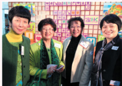
參與政府項目「家是香港」及啟動禮。 Participated in "HK Our Home" and the kick-off ceremony.