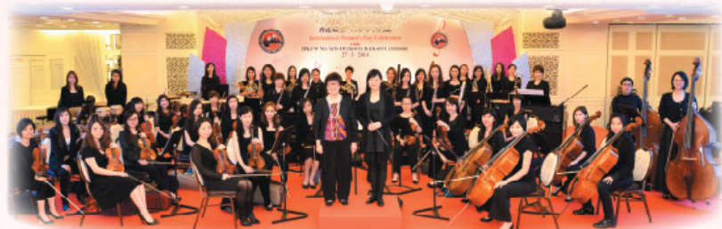
慶祝三八婦女節暨六藝管弦啟動禮。

The 65th National Anniversary Celebration cum HKFW Six Arts Concert for the Inauguration of its Orchestra and Choir.