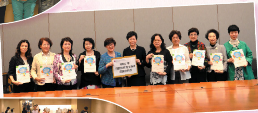
向政務司司長林鄭月娥遞交 「2017年行政長官產生辦法」 諮詢意見書。 Submission of HKFW's proposal on method for selecting the Chief Executive.